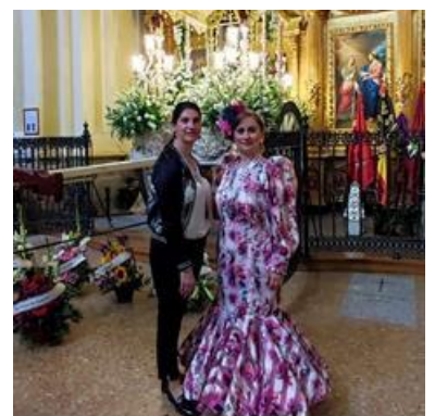
HERMANDAD DE NTRA. SRA. DEL ROCÍO LA ESTRELLA DE MADRID