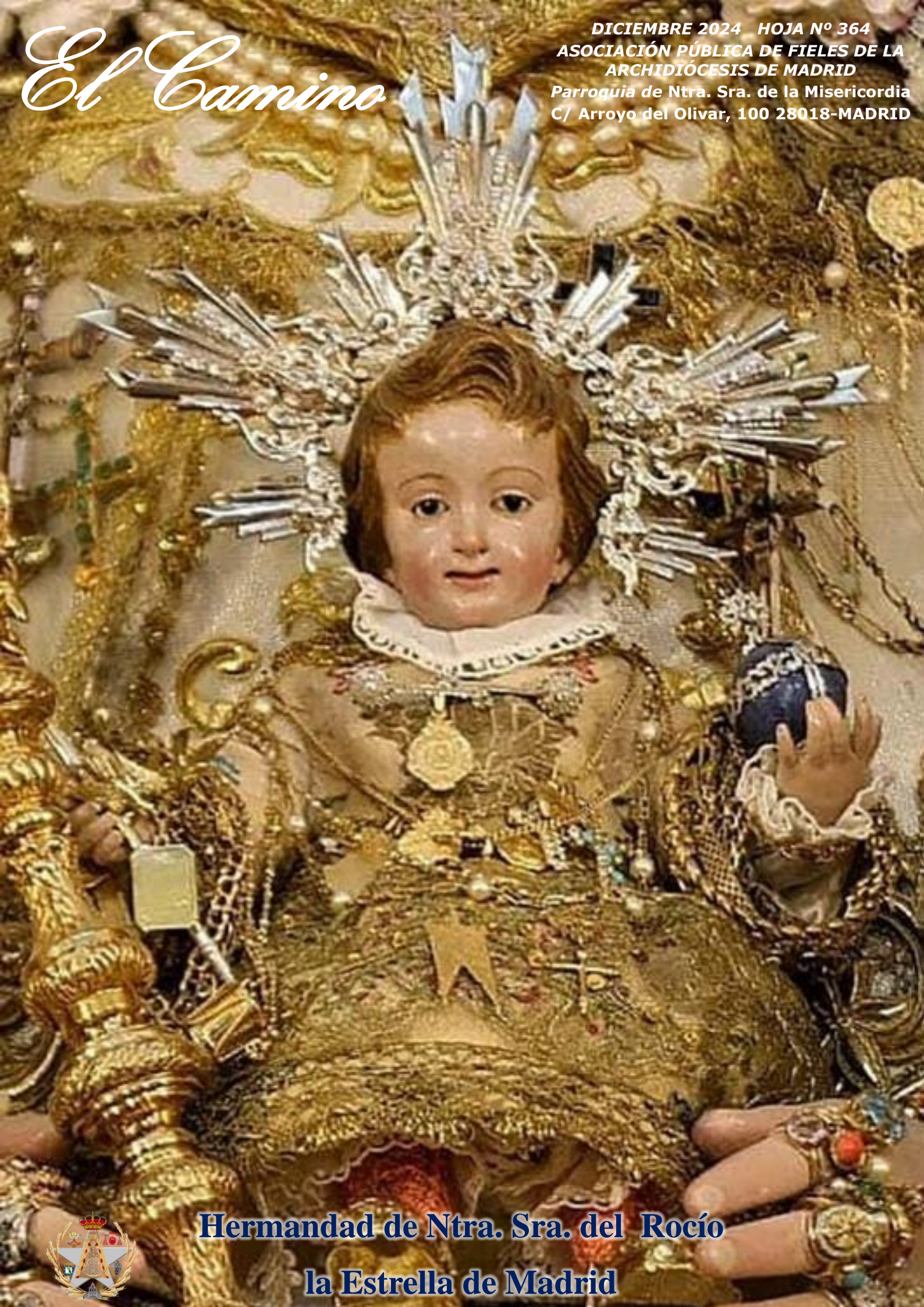
Hermandad de Ntra. Sra. del Rocío la Estrella de Madrid