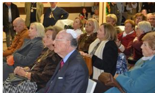
HERMANDAD DE NTRA. SRA. DEL ROCÍO LA ESTRELLA DE MADRID